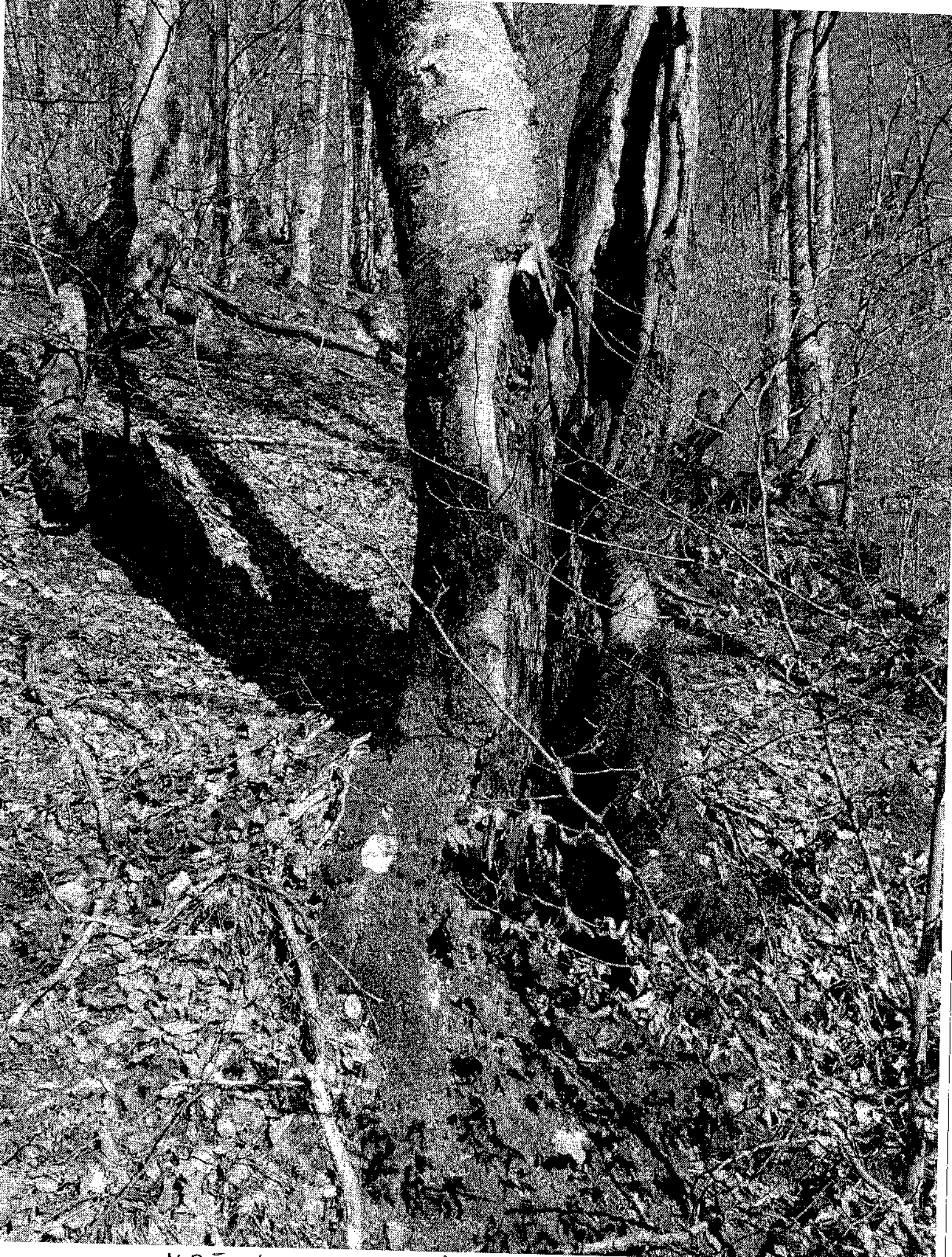
UPI NO 180 B Alagps